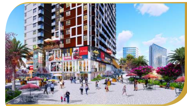
phối cảnh trung tâm thương mại

Bên cạnh đó The EastGate còn là một dự án với nhiều tiện ích cho quý khách hàng như tầng Trung tâm thương mại, Dịch vụ, Hồ bơi, BBQ, Công viên, nhà trẻ, Khu ẩm thực... mang đến sự hài lòng vượt trên cả sự mong đợi cho khách