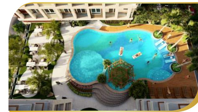
phối cảnh hồ bơi