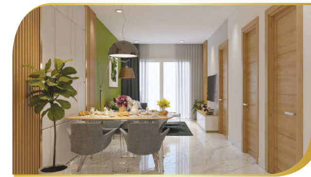
phối cảnh nội thất