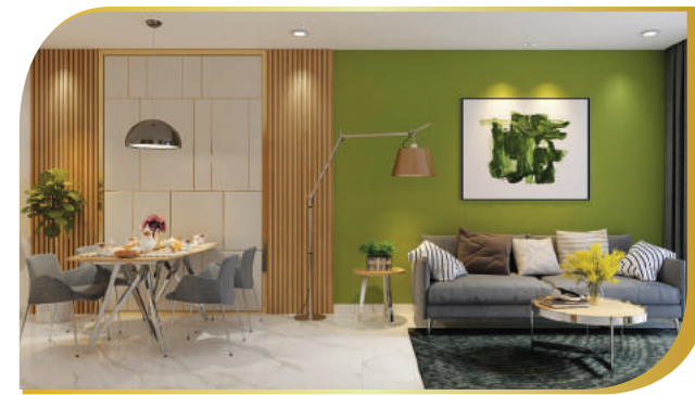
phối cảnh nội thất